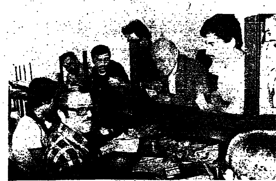
أمين الصندوق... المهندس الوحيد يعاونه احد المتبرعين

كتب فيصل القواص: بدأ العمل في المركز الجديد للهامية في ساقية الجوزير صباح أمس بموظف واحد، انتقل الى مركز الهامية مع ذلك التوافق المستطع على اسمها... وخدمة المشتركين التي مع تواترهم المستحقة الى صندوق المركز الجديد لافت اقبالاً كبيراً تفادى المواطنين والشركاء الذين تواجدوا يوم تنظيم كسب ما يربطهم الى الصندوق كمنهم.